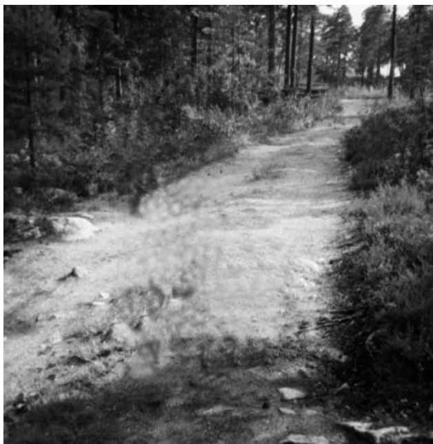
Tykkätie vuonna 1973.

Rentukka-projekti järjesti Jaaninojan ympäristössä useammatkin talkoot, joissa tehtiin harvennushakkuita ja haketettiin polkua. Lisäksi viheryksikkö raivasi itse Jaaninojaa. Lopputuloksena on todella onnistunut. Käytiin myös Rentukka-projektin kanssa katsomassa vanhan tykkätien reittiä ja suunniteltiin sen kunnostamista ja jatkamista ulkoilureittinä Jaaninojalle asti talkoilla. Ikävä kyllä jostain syystä talkoot eivät koskaan toteutuneet. Viheryksikkö raivasi ulkoilureitiksi Suokadun länsipuolen omakotialojen takana kulkevan polun harventamalla umpeenkasvanutta metsikköä ja hakettamalla polun.