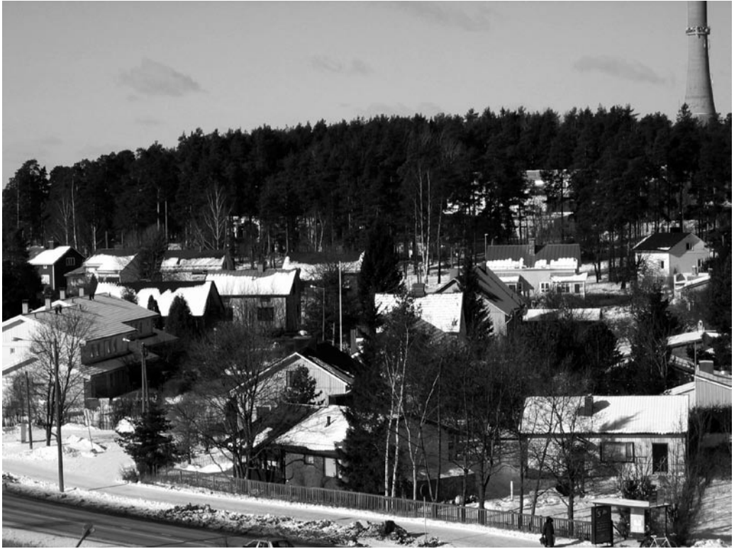
Pääskyvuorta vuonna 2005 Linkkihallin takaa kuvattuna.