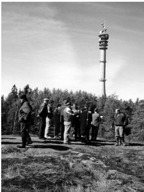
Korkein hallinto-oikeus ”jalkautuneena” Pääskyvuoren kaava-alueella 1997.

Alueen metsät ovat säilyneet melko luonnontilaisina ja edustavat tyypeiltään monipuolisesti metsäluontoa, aivan karuista kasvupaikoista hyvin reheviin. Esim. opastetulle luontopolulle löytyisi alueelta runsaasti kohteita”.