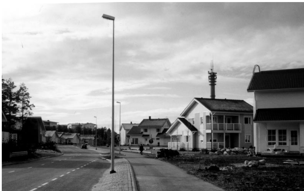
Naulainten ja sähkösirkkeliiden pärinää Pääskyvuoren uuden alueen rakennuksilla syksyllä 2002. Alueella on yli 30 omakotitaloa.

Kun korkein hallinto-oikeus käyntinsä jälkeen hyväksyi kaavan, suunnitelmasta oli poistettu kaksi kerrostaloa ja maisemallisesti arvokkaasta alueesta säästettiin rakentamiselta kallion laki. Jotain kuitenkin oli voitettu.