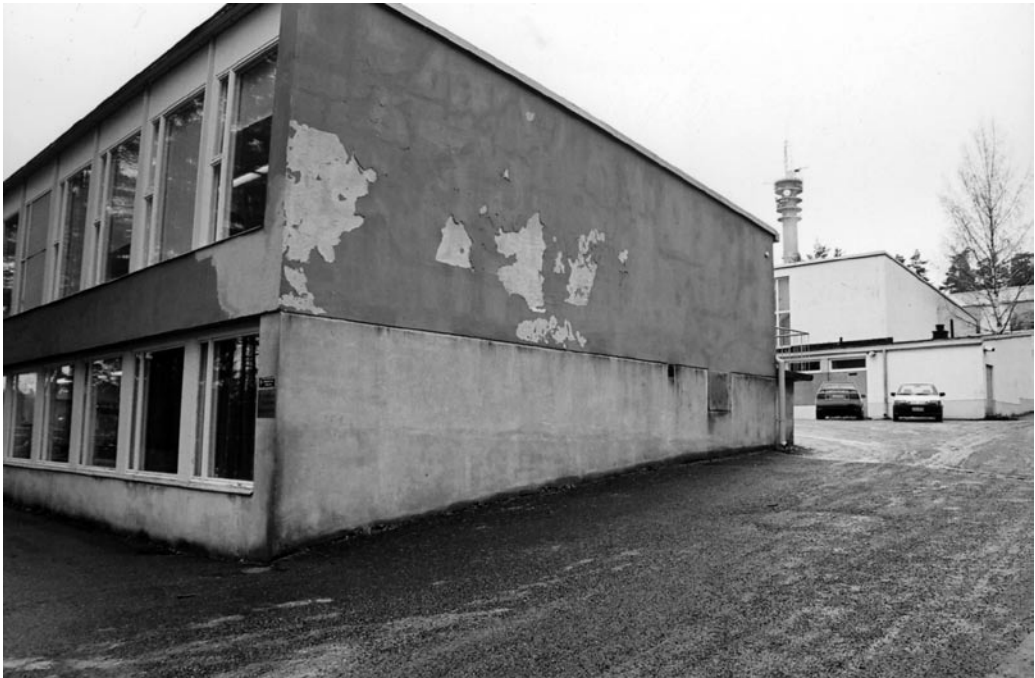
Pääskyvuoren koulun ulkoseinätkin alkoivat paljastaa home- ja vesivaurioita ennen kuin koko koulun remontti saatiin käyntiin.

Lautakunta päätti kokouksessaan 16.1.2003, että palvelulinjan P2 reitti muutetaan kulkemaan suunniteltujen aikataulujen mukaan Pääskyvuorelle ja että muutos otetaan käyttöön kesäaikataulujen alkaessa 22.4.2003. Tällä järjestelyllä saatiin Pääskyvuoren laen asukkaille heidän kipeästi kaipaamansa palvelu.